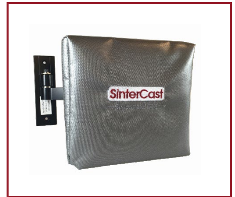
SinterCast Tracking Technologies