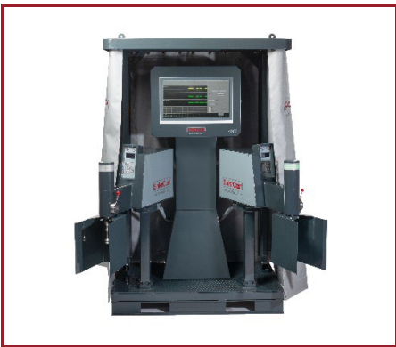
Automated System 4000 Fully Automated Series Production